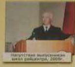
Магасе выступил на заседании, 2009г.