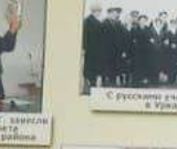
С группой коллег в Магасе, Магасе, 1962г.