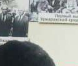
С группой коллег в Магасе, Магасе, 1962г.