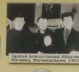
С группой коллег в Магасе, Магасе, 1962г.