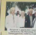
Встреча с группой коллег в Магасе, Магасе, 1962г.