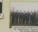
С группой коллег в Магасе, Магасе, 1962г.