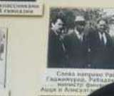
С группой коллег в Магасе, Магасе, 1962г.